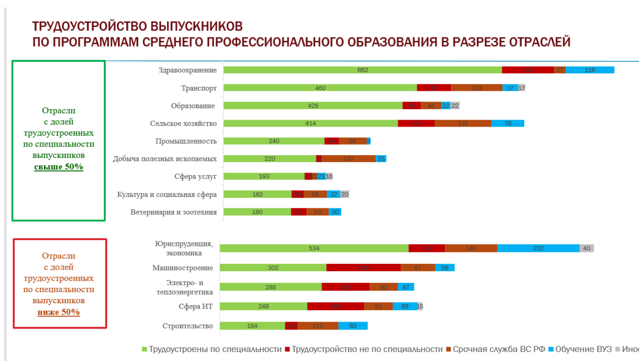
Рисунок 2. Трудоустройство выпускников СПО в разрезе отраслей (в том числе по полученной профессии/ специальности)

В пяти отраслях зафиксировано трудоустройство выпускников по специальности ниже 50: «Юриспруденция, экономика», «Машиностроение», «Электро- и теплоэнергетика», «Сфера ИТ», «Строительство».