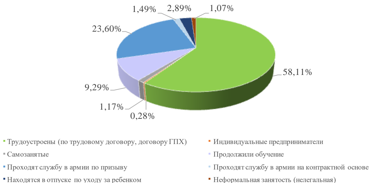
Рисунок 2. Распределение выпускников профессиональных образовательных организаций Белгородской области 2021 года по каналам занятости

В соответствии с методикой расчета показателя федерального проекта «Молодые профессионалы» доля выпускников образовательных организаций, реализующих программы среднего профессионального образования 2021 года, занятых по виду деятельности и полученным компетенциям составила 67,3%. Распределение выпускников 2021 года по каналам занятости по состоянию на 1 июня 2022 года отображено на Рисунке 2.